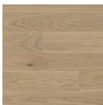
Eik Harmoni Norden