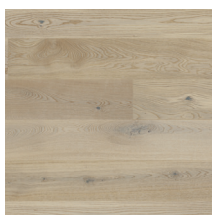
Eik Harmoni Nordlys