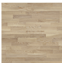
Eik Harmoni Tradisjon