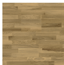
Eik Harmoni Natur