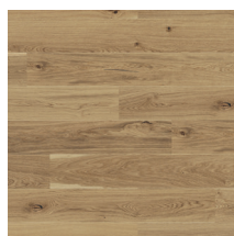
Eik Harmoni Rustikk Børstet