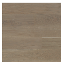
Eik Harmoni Skandinavia