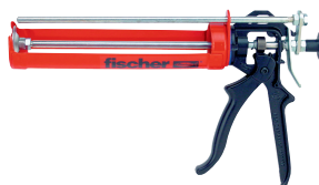
Injeksjonspistol FIS AM Metall