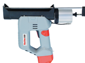
Batteri-injeksjonspistol FIS AA (med innstilling for mørtelmengde)