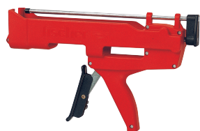
Injeksjonspistol FIS AK Kunststoff