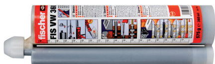
Forankringsmørtel FIS V 360 S styrenfri hybridmørtel