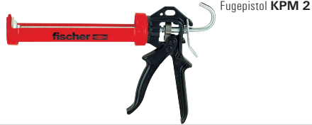
Fugepistol KPM 2