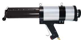
Trykklufts-injeksjonspistol FIS AJ (anbefalt trykk 6 bar)