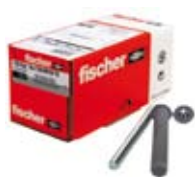
Injeksjonsinnfestingssett FIS sett 16x130 M10/20