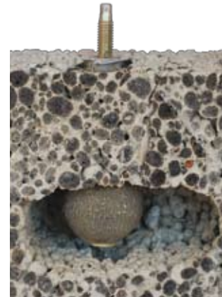
Netthylse FIS HN med FIS VS 300 T i Leca hulrom.

1) max. antall ved anvendelse av 1 mixerspiss.