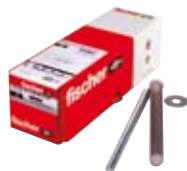
Injeksjonsinnfestingssett FIS sett 20x200 M12/20