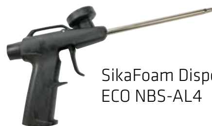
SikaFoam Dispenser ECO NBS-AL4